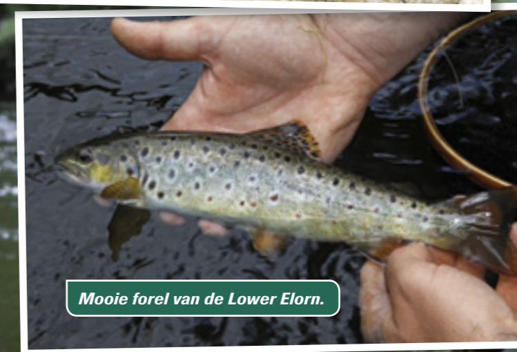
Mooie forel van de Lower Elorn.